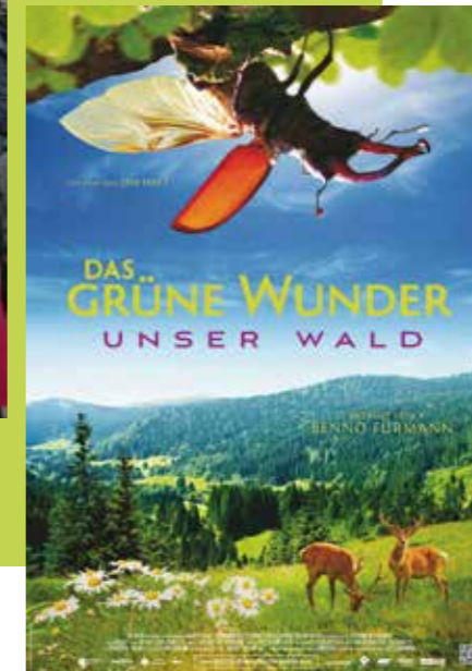
das Wunder le miracle