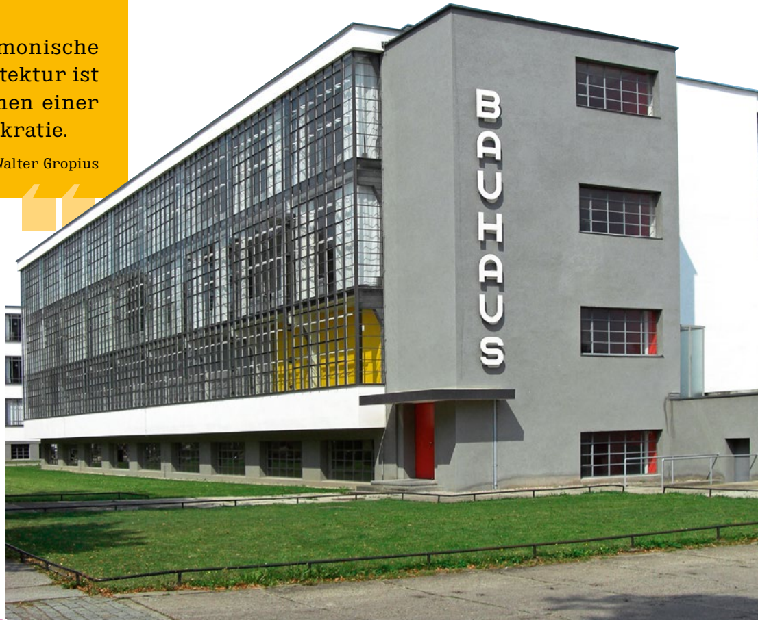
B Bauhaus, Dessau